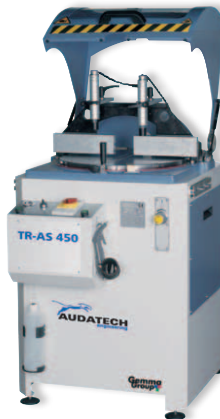
Versione apertura automatica Automatic opening version